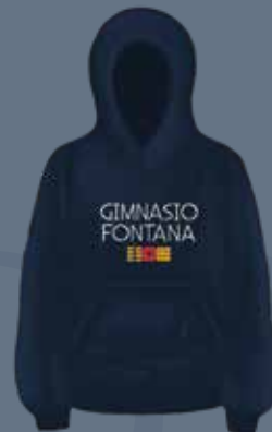
Buzo Perchado Azul