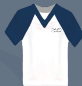
T-Shirt Blanca Deportiva