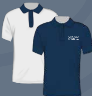
T-Shirt color Jaspado y Azul