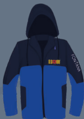
Chaqueta de Frio