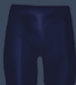
Bicicletero Básico Azul