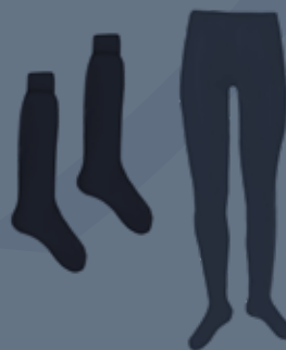
Media Media Azul y/ó Media Malla Azul