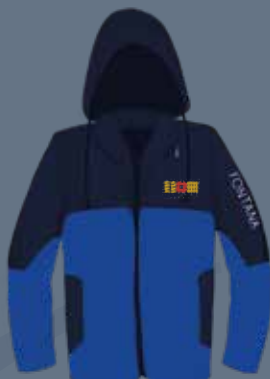
Chaqueta de Frío